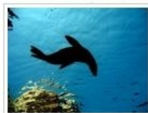
Isla Espiritu Santo

Ernesto Vázquez La foto ganadora del concurso "Mis imágenes del Parque Nacional Archipiélago de Espíritu Santo".